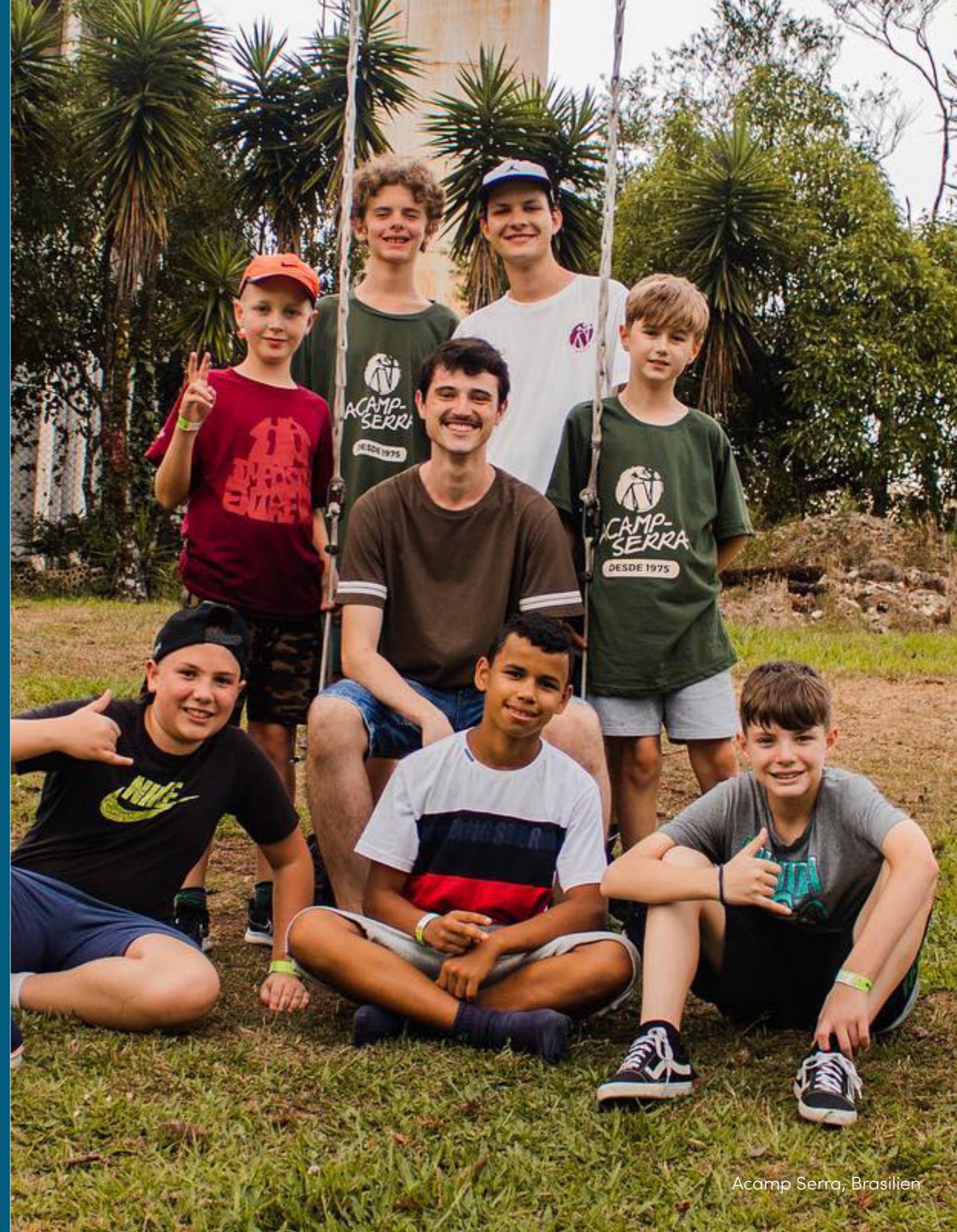
Acamp Serra, Brasilien