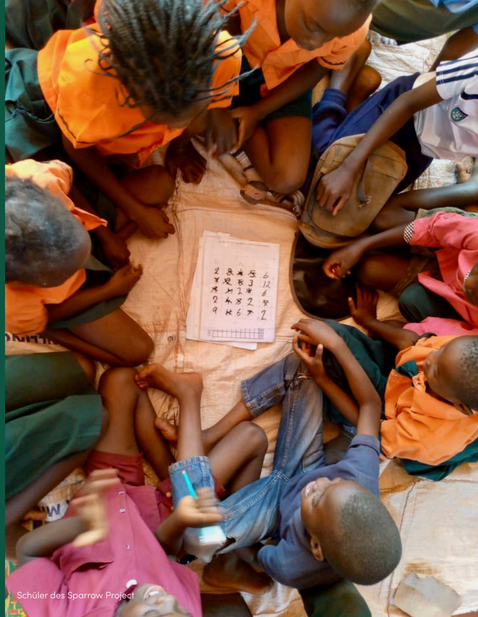
Schüler des Sparrow Project