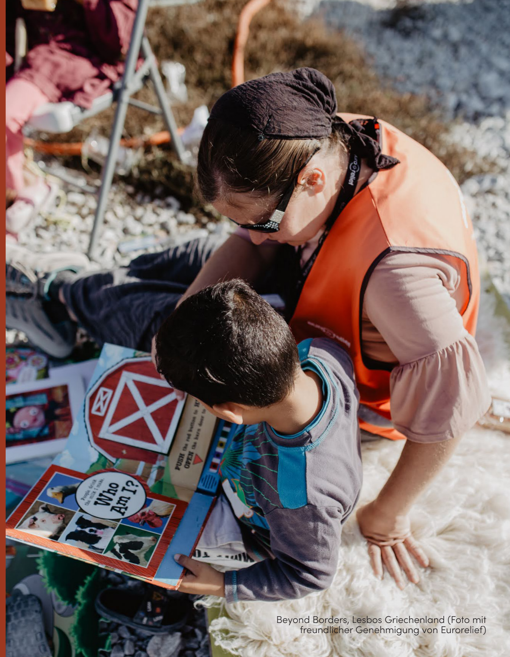
Beyond Borders, Lesbos Griechenland