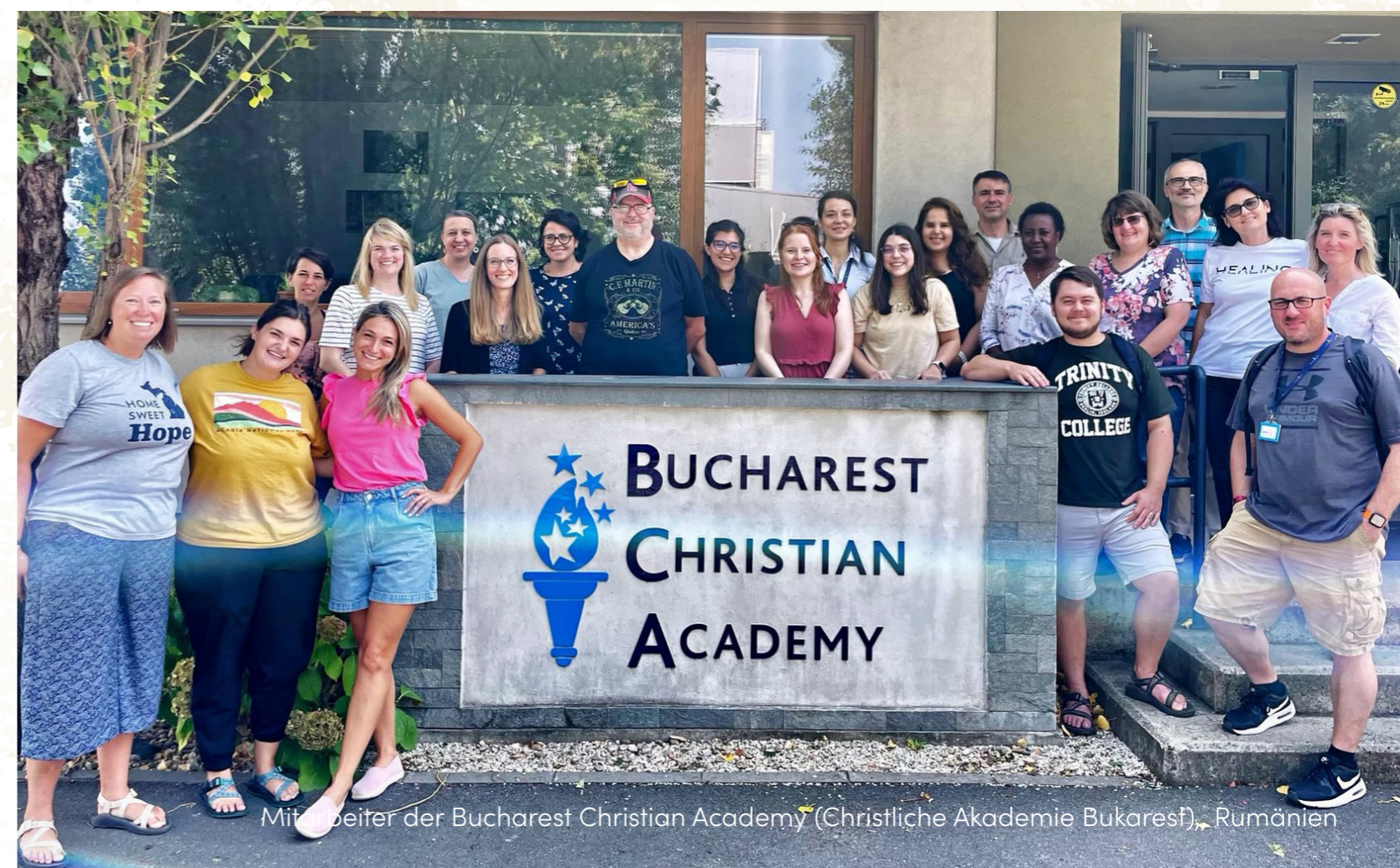
Mitarbeiter der Bucharest Christian Academy (Christliche Akademie Bukarest), Rumänien